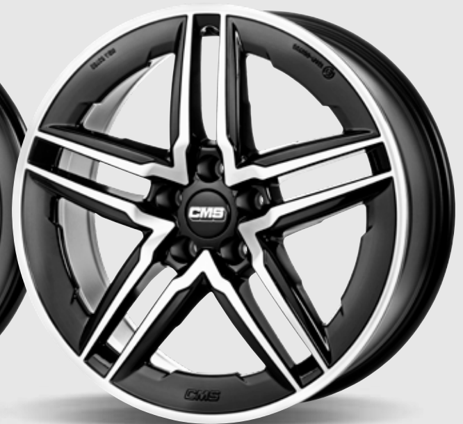
CMS C29 Aero-DB